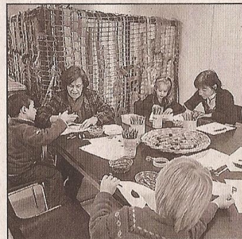
Due momenti dedicati ai bambini nella mattinata di ieri al parco di San Giovanni

semplice e spontanea, senza pensare a differenze di classe o etniche. Il fatto di creare una maschera - ha aggiunto - è per un bambino un gioco di creatività che rifugge gli stereotipi, mentre per un adulto può essere un modo per riflet-